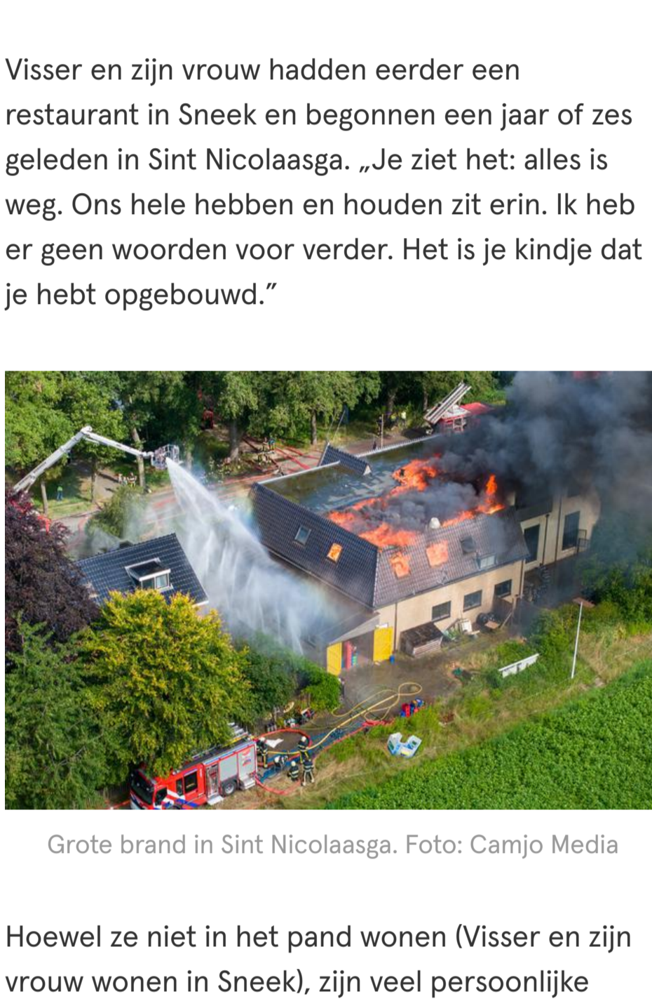
Van het restaurant is door de brand weinig meer over.

Ook volgens restauranteigenaar en gastheer John Visser leek het in eerste instantie mee te vallen. „Mijn vrouw weet nog niet eens dat het weg is”, zegt hij tegen het middaguur over zijn mede-eigenaar en restaurantkok. Die is dan bij een crematie. „Ze dacht: het valt wel mee. Het viel vanmorgen ook wel mee. En nu ineens is alles weg.”